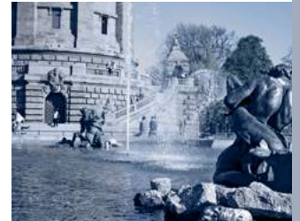
Viktorturm und Wasserturm