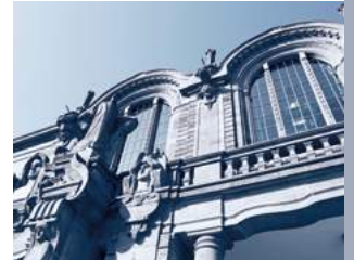
Friedrichsplatz und Rosengarten